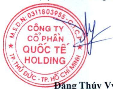
Đặng Thúy Vy