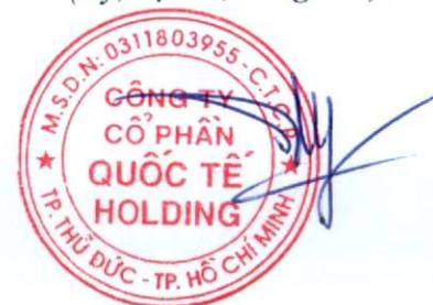
Đặng Thúy Vy